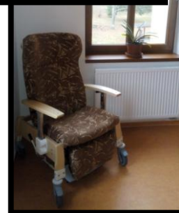
Fotografie po realizaci

Na tento projekt byla poskytnuta finanční podpora z Evropské unie v rámci Integrovaného regionálního operačního programu – specifický cíl 2.1: Zvýšení kvality a dostupnosti služeb vedoucí k sociální inkluzi.