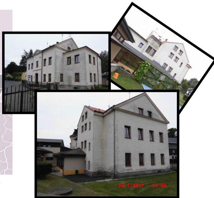
Fotografie před realizací