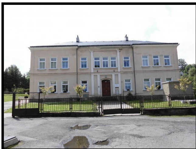
Fotografie před realizací