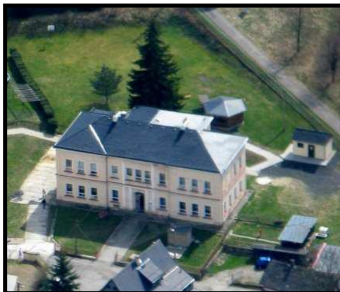
Fotografie před realizací