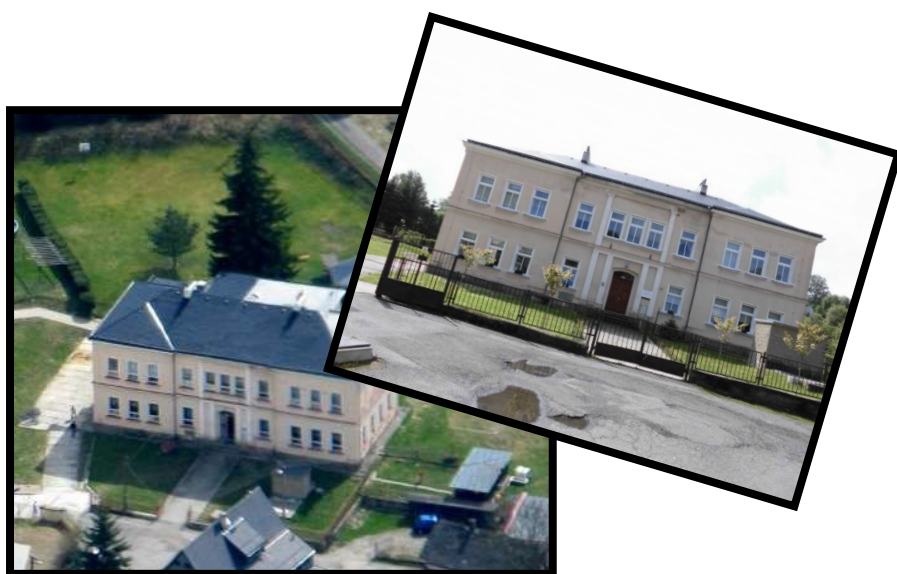
Fotografie před realizací (výše)