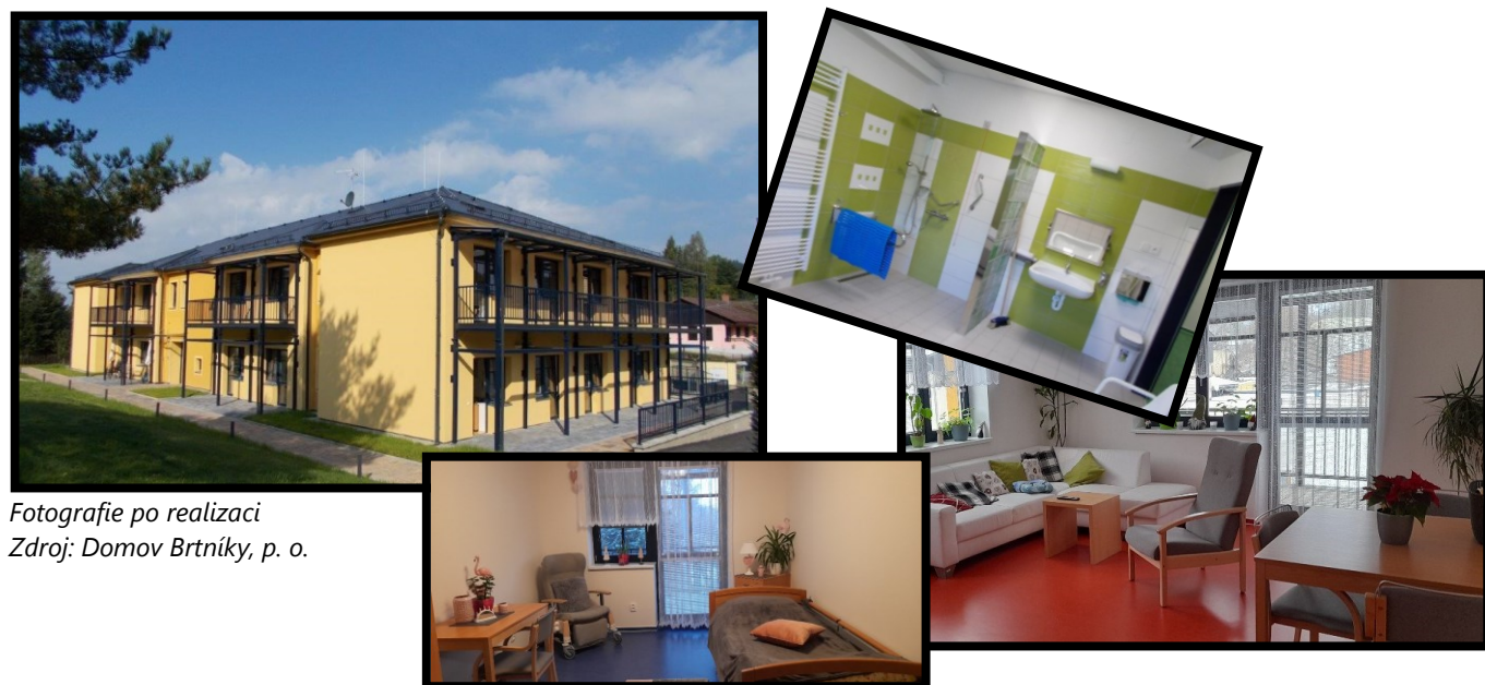
Fotografie po realizaci