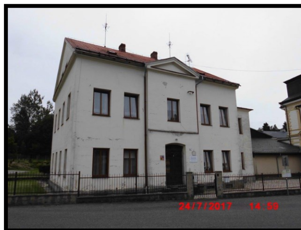
Zdroj: Studie proveditelnosti k projektu